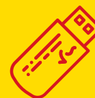
Аппаратный носитель лицензий (USB)

Программные лицензии имеют более 30 различных параметров, позволяющих, при необходимости, использовать уникальные настройки конфигурации, в том числе ограничение работы конфигурации по времени. Возможность частичного или полного ограничения может быть использована в различных сценариях работы конфигурации: